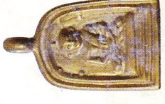
จอบเล็ก เนื้อทองเหลือง (สร้างจำนวน ๑๑,๕๗๘ องค์) ราคา ๒๐๐ บาท