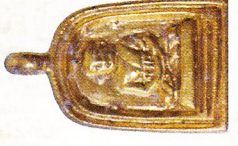
จอบเล็ก เนื้อทองคำ (สร้างจำนวนจำกัด) ราคา ๓๐,๐๐๐ บาท

องค์ลอย เนื้อเงิน สร้างจำนวน ๔๗๘ องค์ ราคา ๑,๐๐๐ บาท องค์ลอย เนื้อทองแดง, เนื้อทองเหลือง สร้างจำนวน ๒,๕๗๘ องค์ ราคา ๒๐๐ บาท