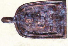
จอบเล็ก เนื้อทองแดง (สร้างจำนวน ๕,๕๗๘ องค์) ราคา ๓๐๐ บาท