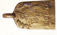
ด้านหลัง จอบใหญ่

องค์ลอย เนื้อเงิน สร้างจำนวน ๔๗๘ องค์ ราคา ๑,๐๐๐ บาท องค์ลอย เนื้อทองแดง, เนื้อทองเหลือง สร้างจำนวน ๒,๕๗๘ องค์ ราคา ๒๐๐ บาท