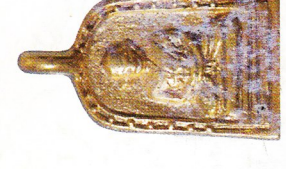
จอบใหญ่ เนื้อทองเหลือง (สร้างจำนวน ๒๑,๕๗๘ องค์) ราคา ๓๐๐ บาท