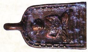
จอบใหญ่ เนื้อทองแดง (สร้างจำนวน ๑๑,๕๗๘ องค์) ราคา ๔๐๐ บาท