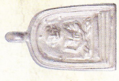
จอบเล็ก เนื้อเงิน (สร้างจำนวน ๒,๕๗๘ องค์) ราคา ๑,๕๐๐ บาท