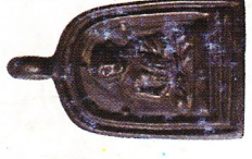
จอบเล็ก เนื้อวไลหะ (สร้างจำนวน ๓,๕๗๘ องค์) ราคา ๗๐๐ บาท