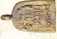
ด้านหลัง