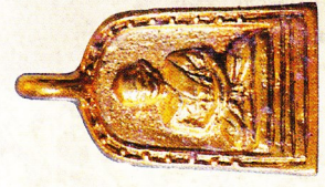
จอบใหญ่ เนื้อทองคำ (สร้างจำนวนจำกัด) ราคา ๖๐,๐๐๐ บาท