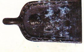
จอบใหญ่ เนื้อวไลหะ (สร้างจำนวน ๕,๕๗๘ องค์) ราคา ๙๐๐ บาท