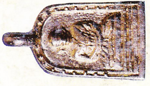
จอบใหญ่ปากากษ์ เนื้อทองขาว (สร้างจำนวน ๓,๕๗๘ องค์) ราคา ๑,๙๙๙ บาท