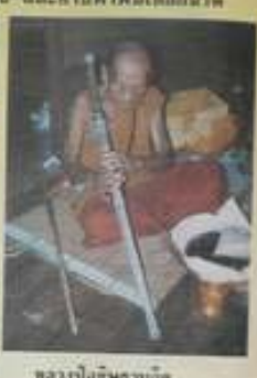
หลวงปู่ธวัชฐวัฒน์ "ดาบเทพเส้าร์เงินทรวงู" เป็นพิเศษที่ระลึก