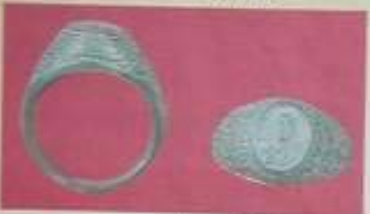
แหวนทองรูปหมุน เนื้อเงิน