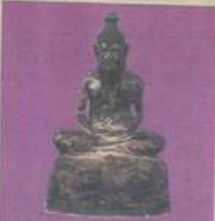
ปูจุมนักรอก ขนาด 9 นิ้ว