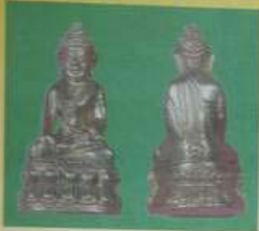
พระกริ่ง รุ่นสัมฤทธิ์ผล เนื่องกรมเหล็กธรรมนบุรี

อมตสงฆ์ทรงอกัญญา 5 แผ่นดิน อธิษฐานจิต "ดาบเหล็กน้ำพี้" และวัดดุมงคลรุ่นพิเศษ "เส้าร์ ๕ มหาเศรษฐี" วันเสาร์ที่ 8 เมษายน 2543 ณ วัดป่าหนองหล่ม