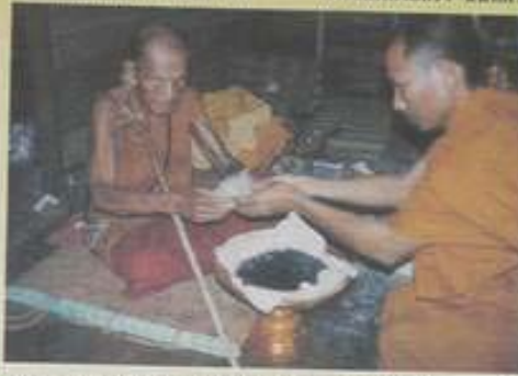
ฉนวนพระคุณโกฎิพระราชาเจ้าองค์ อุตสึเไส เ้าวาราเว็ป่าหนองหล่ม