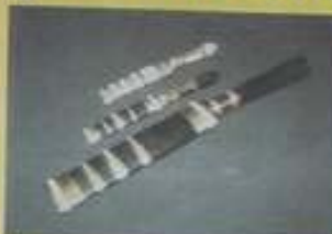
มีดหมอเหล็กเส้าร์เหล็กน้ำพี้