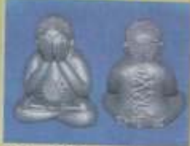
พระนิลคาหม้น้ำ 100 % เส้าร์ ๕ มหาเศรษฐี จำนวนสร้างเพียง 109 องค์