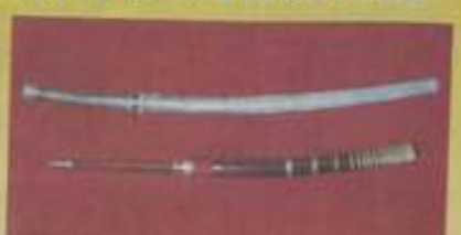
ดาบเทพเส้าร์ "น้ำทรวงู" และดาบฟ้าเงินเหล็กน้ำพี้