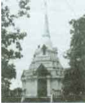
พระเจดีย์

หลังจากที่หลวงปู่แหวน มาพำนักที่วัดออยแม่ปิ้ง ไม่นานนัก ท่านก็เริ่มอาพาธอีกครั้งหนึ่ง ตอนนี่เกิดเป็นตมคัน ไปทั้งตัว นับวันแต่จะเป็นมากขึ้น