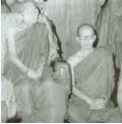
หลวงปู่แหวนกับ พระครูวิมลศีลวงค์ (สมณศักดิ์ในขณะนั้น วัดสัมพันธวงศ์ กรุงเทพฯ)

เมื่อก่อนนี้สมัยที่ท่าน(พระครูฯ) เดินทางไปหาหลวงปู่แหวน ที่วัดดอยแม่ปิ้งใหม่ๆ ใหม่ๆ ใหม่ๆ นั้นท่านเองก็มีความรู้สึกที่ตื่นเต้น ในวัดถมดหลวงปู่แหวนมาก แต่ต่อมาภายหลัง เมื่อมีโอกาสได้สนทนารวมกับหลวงปู่บ่อยเข้า ท่านกล่าวว่า สถิติปัญญาของหลวงปู่แหวนนั้น แผลมคมยิ่งนัก ถ้าใครไปถามท่านในเรื่องที่ไม่เป็นเรื่อง ก็อาจจะโดนท่านย้อนจนพูดไม่ออกบอก ไม่ได้ทีเดียว