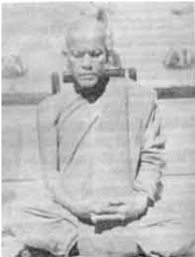
หลวงปู่ตื้อ อจลธมฺโม

ทางภาคเหนือ เป็นสถานที่ที่ทั้งสององค์ยังไม่เคยไปมาก่อน จึงตกลงเดินทางมุ่งสู่ ภาคเหนือ ทันที