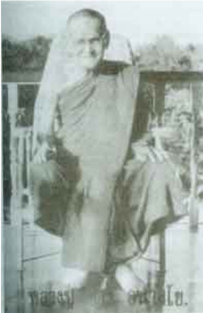
หลวงปู่ขาว อนาลโย วัดถ้ำกลองเพล ต.โนนทัน อ.เมือง จ.หนองบัวลำภู

ธรรมสัปปายะ เพราะพระอาจารย์ผู้แสดงธรรมท่านก็ย้ายลงในธรรมปฏิบัติ ในสารธรรมอัน เป็นวิมุตติธรรม วิโมกขธรรม ซึ่งจุดอันควรละและบอกจุดอันควรเจริญ ยิ่งใกล้วันเข้าพรรษา ท่าน ได้แสดงทางปฏิบัติอย่างลงเป็นจตุๆ เป็นขั้นตอนตามการเจริญมรรคปัญญา โดยเฉพาะ