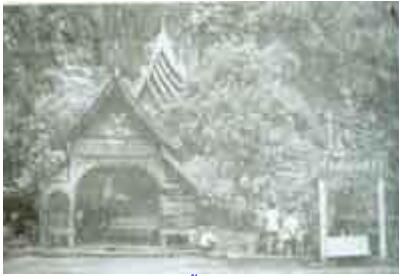
ทางเข้าถ้ำเชียงดาว