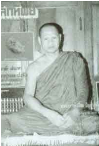
หลวงพ่อเปลี่ยน ปญฺญปทีโป วัดอรัญญวิเวก (บ้านป)

เมื่อชาวบ้านรู้ข่าวว่า หลวงปู่แหวน ไปดอยแม่ปิ้งกับหลวงปู่หนุแล้ว จึงพากันโจษ