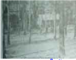
บรรยากาศภายในวัด

ทั้งตัว ต่อมา หนึ่งก็ลอกออกเป็นแผ่นๆ เหมือนงูลอกคราบ