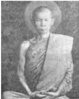
พระญาณวิศิษฐ์สมิทธิวีระจารย์ (หลวงปู่สิงห์ ขนดะยากโม)

ขออนุญาตท่านผู้อ่าน เขียนถึงประวัติ ของหลวงปู่สิงห์ ขนดะยากโม สักเล็กน้อย เพื่อความ เข้าใจของผู้ที่ใหม่ต่อพระป่า สายหลวงปู่มั่น ภูริทัตโต