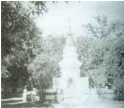
วัดอรัญญวิเวก(บ้านปาง) อ.แม่แตง จ.เชียงใหม่

หลวงปู่หนู อยู่เฝ้าพยาบาล ๗ วัน ท่านต้องกลับดอยแม่ปิ้ง ตามพระวินัย เพราะ