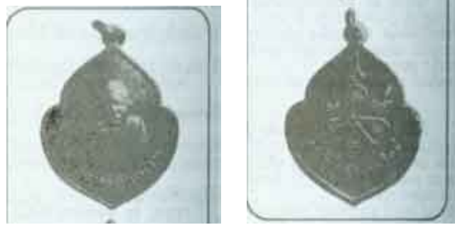
เหรียญหลวงปู่แหวนรุ่นแรก