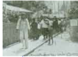
บรรดาสาธุชนที่เดินทางมากราบหลวงปู่แหวน

หลังจากนั้น ผิวหนังของหลวงปู่ก็ดูสดใหม่เป็นปกติ จึงกล่าวได้ว่า อาหารเกือบเอาชีวิตไม่รอด ของหลวงปู่ในครั้งนั้น รักษาหายด้วยยาของ เจ้าหน้าที่ชุดปราบโรคเรื้อนของกระทรวง สาธารณสุข ชุดนั้นโดยแท้