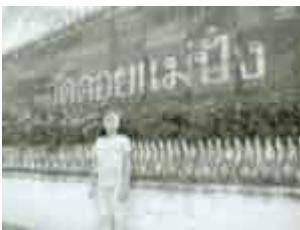
บรรยากาศภายในวัดดอยแม่ปิง ในปี พ.ศ.๒๕๔๕

เมื่อท่านหายจากอาหาร จนมีกำลังแข็งแรงเป็นปกติแล้ว ในฤดูแล้ง เวลากลางวัน บางวัน ท่านก็จะขึ้นไปพักภาวนาอยู่ในกุฏิหอยเหินตลอดวัน จะลงมาเมื่อถึงเวลาสรงน้ำ