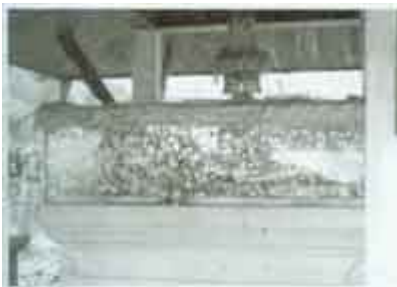
รูปเหมือนหลวงปู่แหวน นอนอยู่ในโลงแก้ว ข้างกุฏิอย่างกิเลสของท่าน

ดังนั้น ภาระหนักในการดูแลหลวงปู่ ถนอมหลวงปู่ ให้อยู่กับพวกเราให้นานที่สุด จึงตกอยู่ที่ หลวงปู่หนู สุจิตโต เจ้าอาวาส