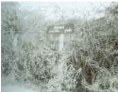
ป่าเมี่ยงแม่สาย อำเภอพร้าว จ.เชียงใหม่

หลวงปู่จึงได้จำพรรษาอยู่ในสถานที่นั้น และนับตั้งแต่ปีนั้นเป็นต้นมา ทั้งหนานปวน และ แม่มาต่างก็รักษาอุโบสถศีล ตอดอดพรรษา และคงยังรักษาทุกพรรษา ต่อมาจนตลอดชีวิต