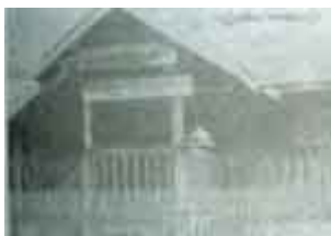
กุฏิหลังใหม่ของหลวงปู่แหวน

เวลานอกจากนั้น ท่านจะอยู่ในกุฏินี้ตลอด ติดต่อกันหลายปี ไม่ว่าหน้าแล้ง หน้าฝน หรือ หน้าหนาว