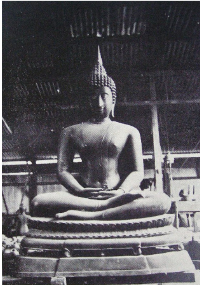
ทรงพระกรุณาโปรดเกล้าฯ ประทาน พระพุทธรูปยืน วิไลนาการมงคล ให้เป็นพระประธาน วัดทรายงาม