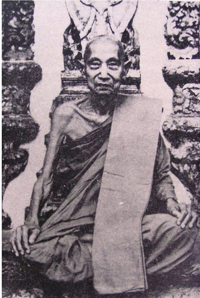
สมเด็จพระสังฆราชเจ้า กรมหลวงวชิรญาณวงศ์ เคยเสด็จวัดทรายงาม จันทบุรี พ.ศ. ๒๔๘๑